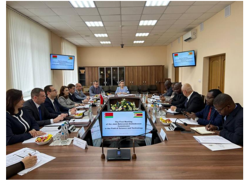
I заседание Совместной Белорусско-Зимбабвийской комиссии в области науки и технологий 16 мая 2023, Минск, Беларусь