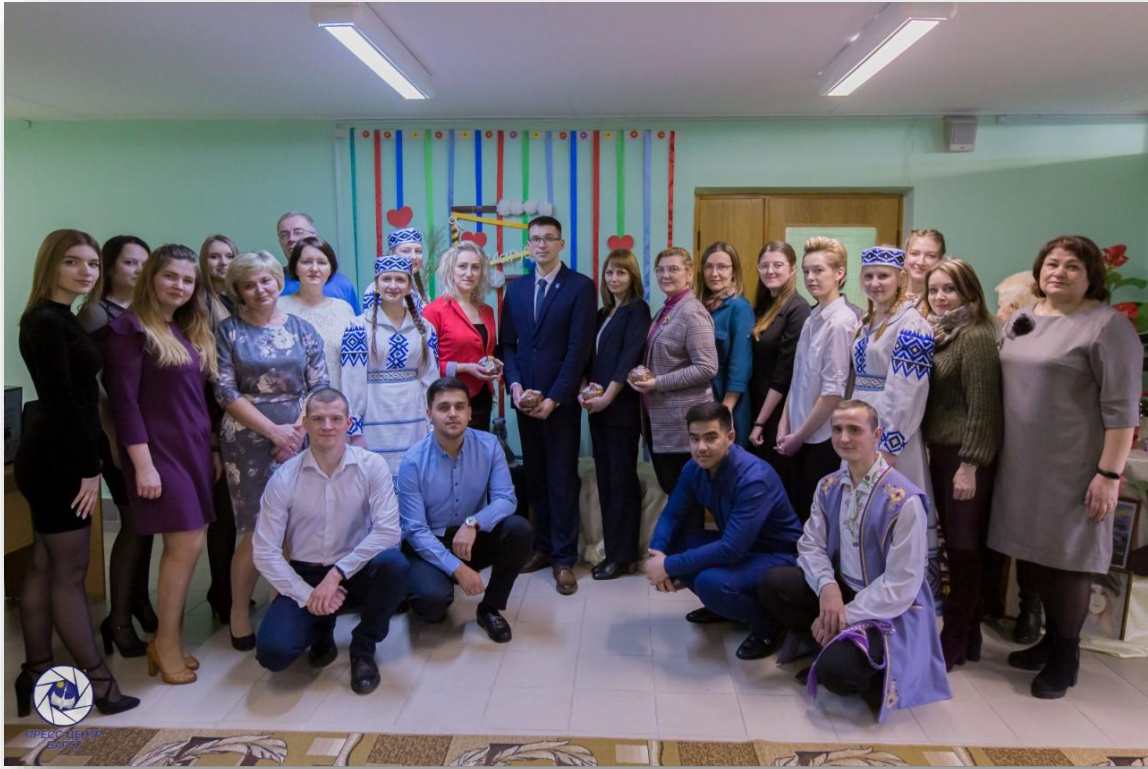
Госці і стваральнікі кутка “Я нарадзіўся тут”.