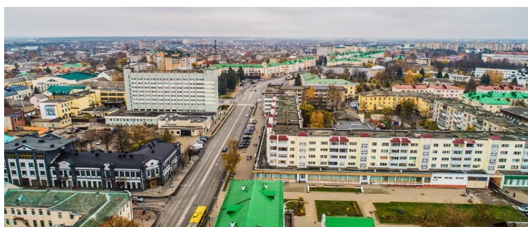
Рисунок 3. Город Барановичи, вид сверху

Город Барановичи не только один из крупнейших городов Белоруссии по численности населения (8-е место в республике), но и один из важнейших промышленных, культурных и образовательных центров Белоруссии.