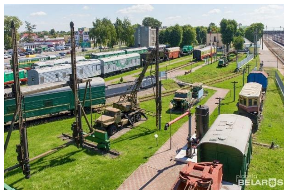
Рисунок 2. Железнодорожные пути

Барановичи характеризуются очень выгодным географическим положением и являются крупным узлом важнейших железных и шоссейных дорог. Здесь близкое расположение магистрального газопровода, развитая система энерго- и водоснабжения, благоприятный климат.