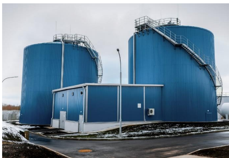
Рисунок 16. Биогазовый комплекс в г. Барановичи

Барановичи – единственный город в Беларуси, где на очистных сооружениях есть биогазовый комплекс. Уникальный объект запустили в конце 2017 года (Рисунок 16). Теперь осадок из городских канализационных стоков превращается в биогаз, а потом – в тепловую и электрическую энергию.