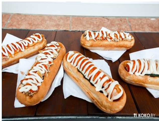
Рисунок 22. Барановичские «Лодочки»

Говорят, что побывать в Барановичах и не попробовать «лодочек» – все равно, что приехать в Париж и не посетить Эйфелеву башню. Сейчас этот фастфуд, который стал народным кулинарным брендом, делают во многих белорусских городах, но впервые «лодочку» приготовили в Барановичах (Рисунок 22).