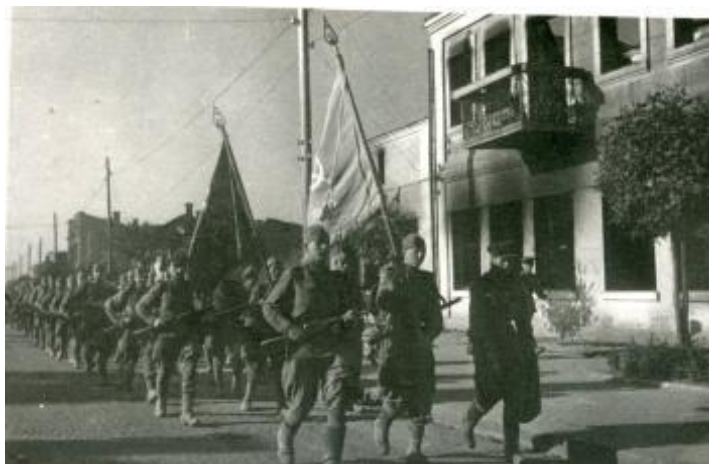
Рисунок 9. Солдаты I Белорусского фронта в городе Барановичи

Минского соединения на Барановичско-Слонимском направлении (операция «Багратион») (Рисунок 9). Эта дата отмечается как День освобождения города.