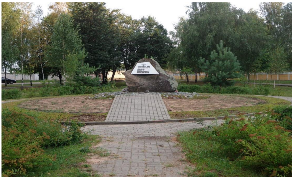
Рисунок 15. Сквер Героя Карвата

Спустя 13 лет в польском городе Радом подвиг Карвата повторили барановичские летчики Александр Марфицкий и Александр Журавлевич.