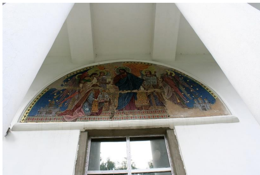
Рисунок 18. Мозаика в Покровском соборе

Она была сделана для Варшавского собора Александра Невского. Храм был разрушен, а мозаика доставлена в Барановичи в 1928 году. Мозаика имеет более 20 000 оттенков смальты и является уникальным произведением искусства в мировом масштабе.