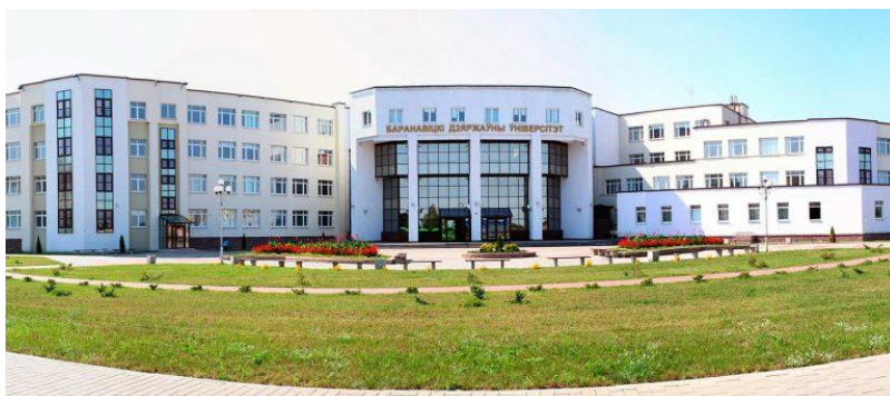
Рисунок 13. УО «Барановичский государственный университет»

В 2019 году университет отметил 15-летний юбилей.