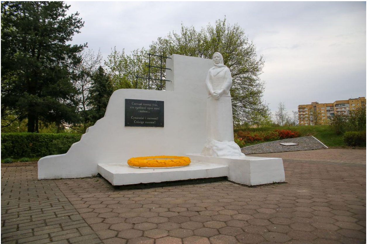
Рисунок 3. Памятник «Скорбящая мать» – мемориальный комплекс «Память»