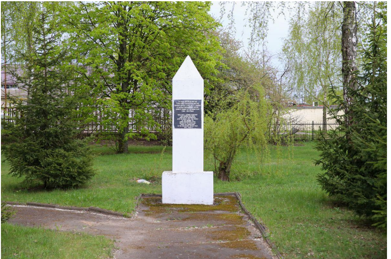
Рисунок 5. Мемориальный комплекс в память об узниках Барановичского гетто и геноциде евреев в г. Барановичи в годы войны на ул. Чернышевского