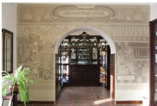
Рисунок 21. Аптека-музей

Шесть лет назад в городе на базе аптеки №21, расположенной на улице Тельмана, открылась аптека-музей – единственная в Брестской области (Рисунок 21).