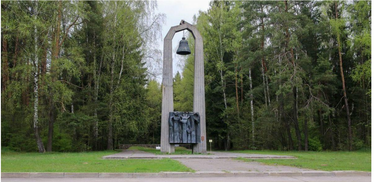
Рисунок 1. Урочище «Гай»