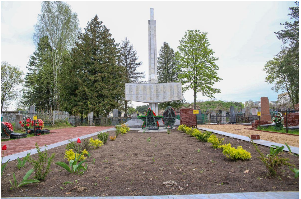
Рисунок 2. Братская могила воинов Великой Отечественной войны (кладбище на ул. Загородной)