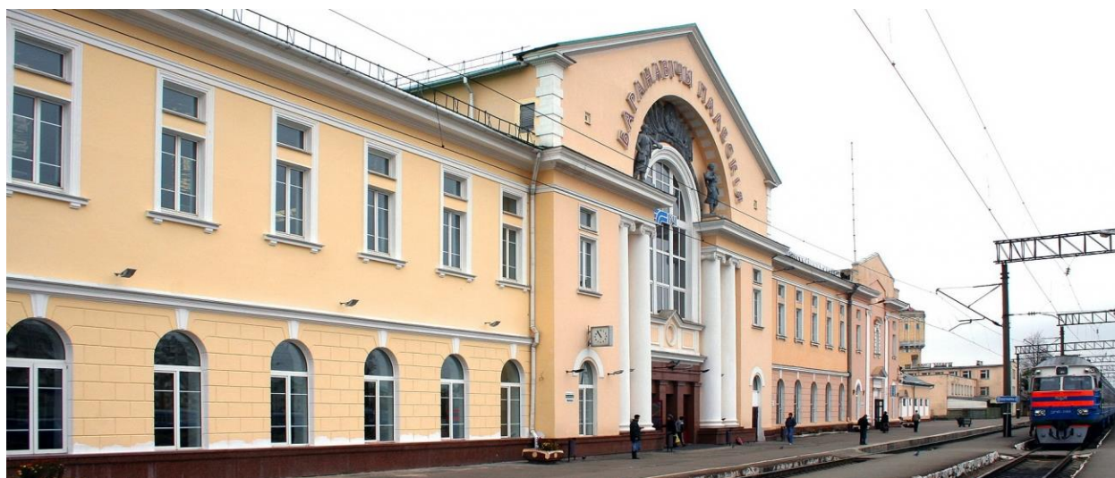
Рисунок 14. Железнодорожный вокзал «Барановичи-Полесские»

Барановичское отделение Белорусской ЖД (Рисунок 14) расположено на территории Минской, Брестской и Гродненской областей, в его состав входит 54 станции и пять крупных ж/д узлов – Барановичи, Лунинец, Лида, Гродно и Волковыск. Общая длина ж/д путей отделения – 2232 км. Барановичское отделение Бел. ЖД осуществляет 30% от всех грузоперевозок внутри страны. Его подразделение – локомотивное депо Барановичи – самое крупное из 17 локомотивных депо Бел. ЖД и единственное предприятие, на балансе которого есть 30 грузовых электровозов повышенной мощности для перевозки тяжеловесных поездов.