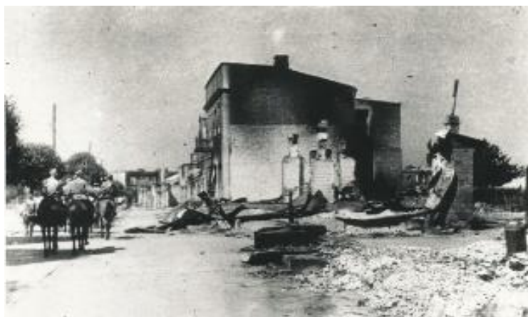
Рисунок 8. Город Барановичи во время Великой Отечественной войны 1941-1945 гг.

В ходе Великой Отечественной войны 27 июня 1941 года город был оккупирован германскими войсками (Рисунок 8). Более 50 тыс. военнопленных и гражданских лиц были расстреляны и замучены в лагере военнопленных № 337 около железнодорожной станции «Лесная», недалеко от города.