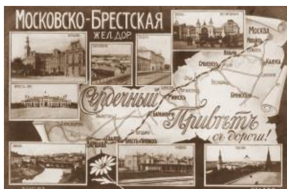
Рисунок 6. Открытка “Московско-Брестская железная дорога”. 1912 год

В 1884 г. этот посёлок получил административный статус – местечко и название – Розвадово. В этом же году рядом со станцией Барановичи-Полесские на землях крестьян деревень Светиловичи, Гирово, Узноги сформировался ещё один посёлок – Новые Барановичи. Он стал вторым центром, вокруг которого проходило формирование будущего города. В конце XIX в. местечко Розвадово и Новые Барановичи слились, образовав единое поселение Барановичи-Розвадово (позже Барановичи) Новогрудского повета Минской губернии. Возникнув на перекрёстке железнодорожных магистралей, которые связали центральные губернии России с её западными границами, а Украину – с портами Балтики, к концу XIX в. Барановичи стали крупным железнодорожным узлом на западных окраинах Российской империи.