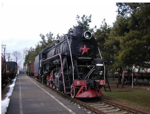
Рисунок 19. Музей железной дороги

Еще одной изюминкой Барановичей является памятник воробью (Рисунок 20). Больше таких в стране нет. Птица поселилась в центре города в 2003 году.