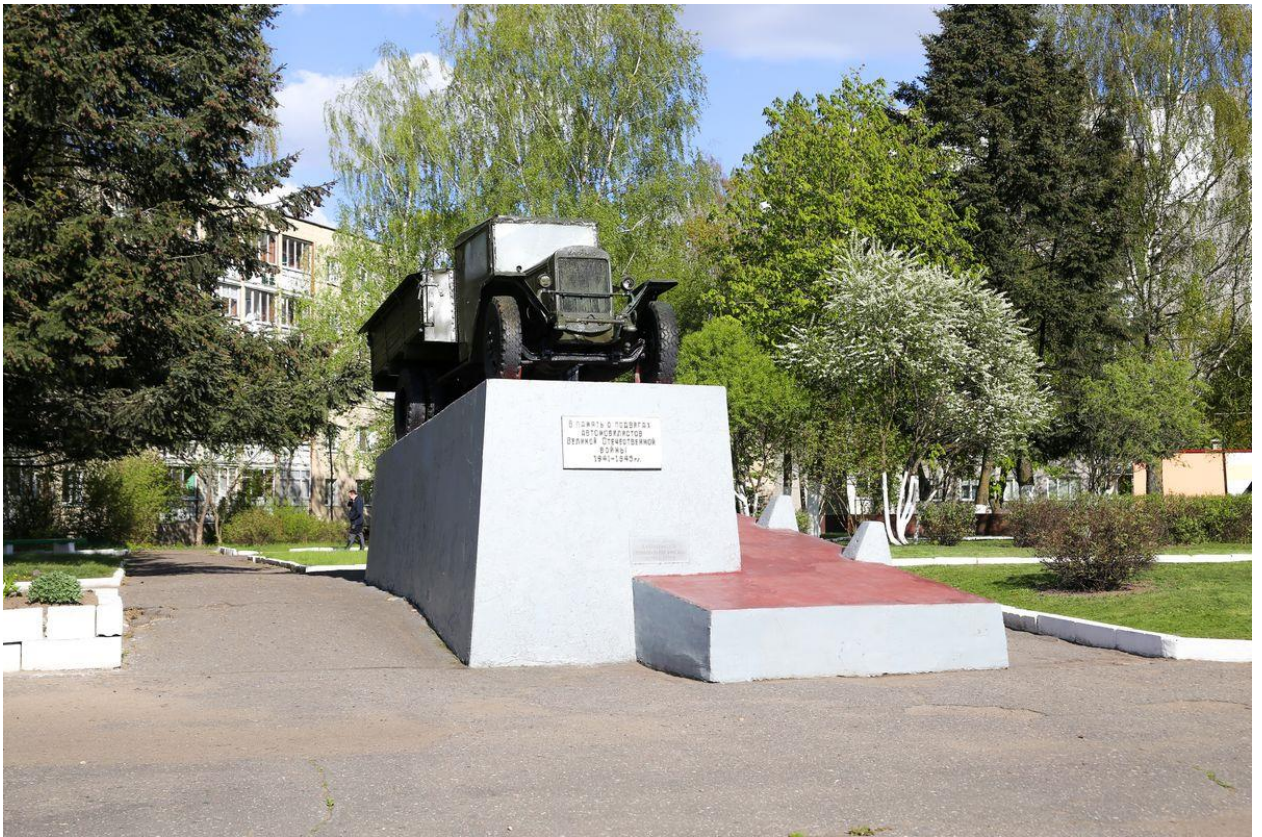
Рисунок 7. Памятный знак в честь воинов-автомобилистов (ЗИС-5 на ул. Тельмана и Циолковского)