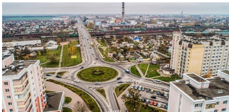
Рисунок 1. Город Барановичи

Барановичи лежат на равнинной местности, где перепад высот не превышает 20 м (от 180 до 200 м над уровнем моря). Высота города над уровнем моря составляет 193 м.