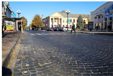
Рисунок 17. Улица Советская, покрытая брусчаткой

Барановичи – один из немногих белорусских городов, где сохранилась улица, покрытая базальтовой брусчаткой, – это участок улицы Советской (Рисунок 17).