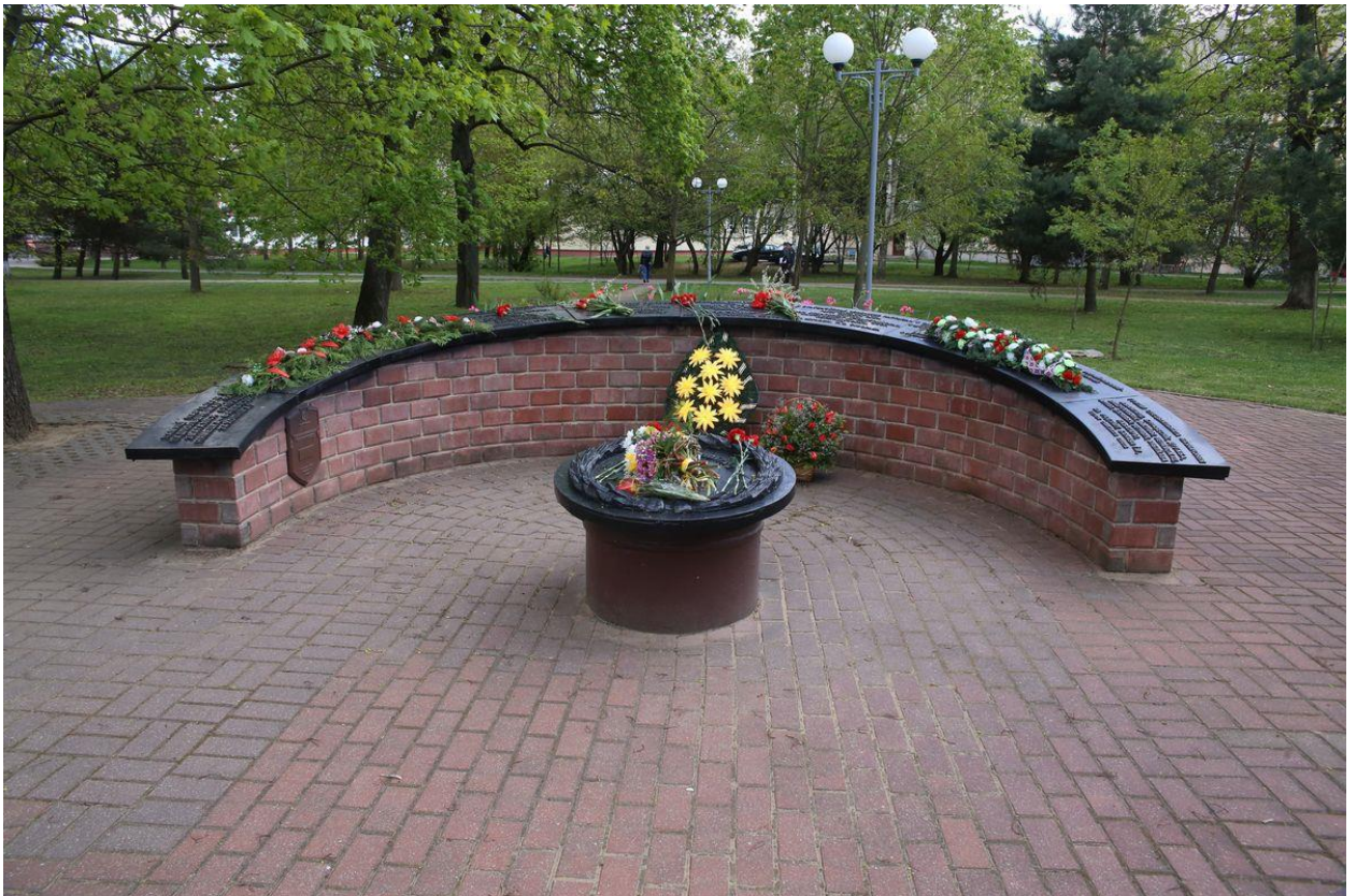
Рисунок 8. Памятный знак в честь партизан Барановичского соединения (перекресток улиц Чкалова и Дзержинского)