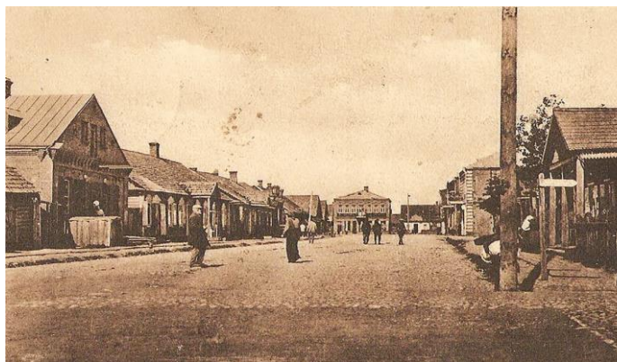
Рисунок 7. Деревянная улица г. Барановичи

В самом начале город был полностью деревянным. Причём, деревянные были и тротуары, чего не было во многих городах того времени (Рисунок 7).