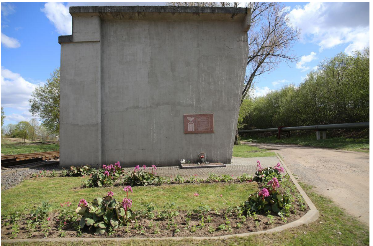
Рисунок 10. Мемориальная доска на месте расстрела узников Барановичского гетто 4 марта 1942 года (Зеленый мост)