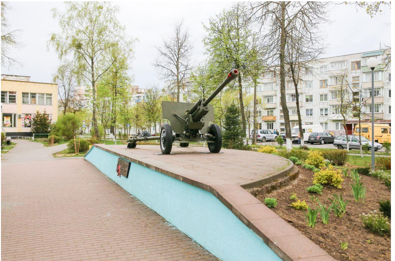
Рисунок 9. Памятный знак в честь воинов-артиллеристов (2-е Третьяки)