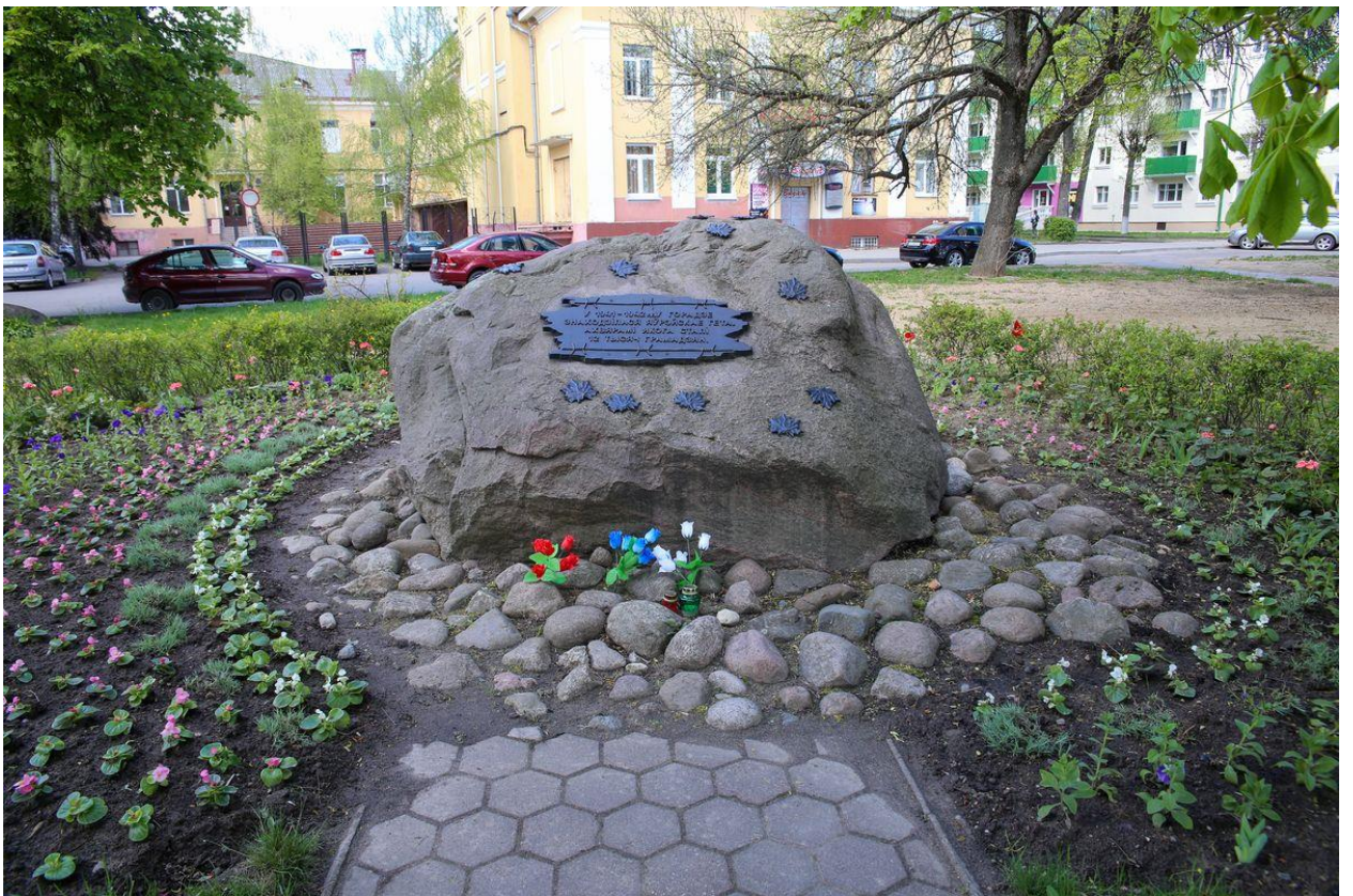
Рисунок 4. Памятный знак о еврейском гетто