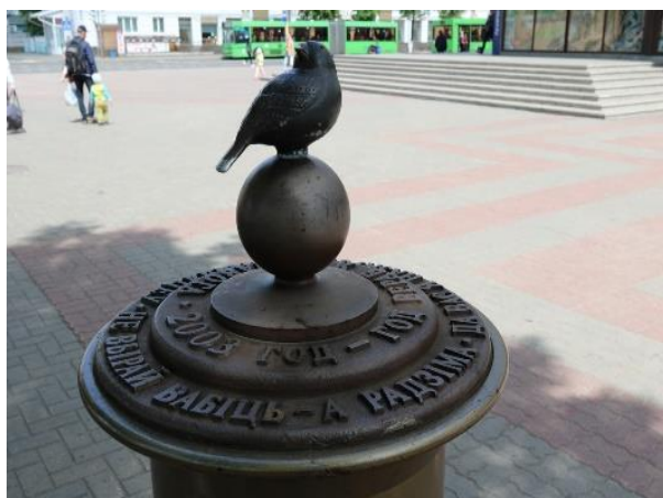
Рисунок 20. Памятник воробью

Еще одной изюминкой Барановичей является памятник воробью (Рисунок 20). Больше таких в стране нет. Птица поселилась в центре города в 2003 году.