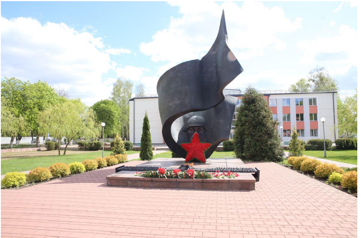
Рисунок 6. Памятник Освобождения («Вечный огонь»)