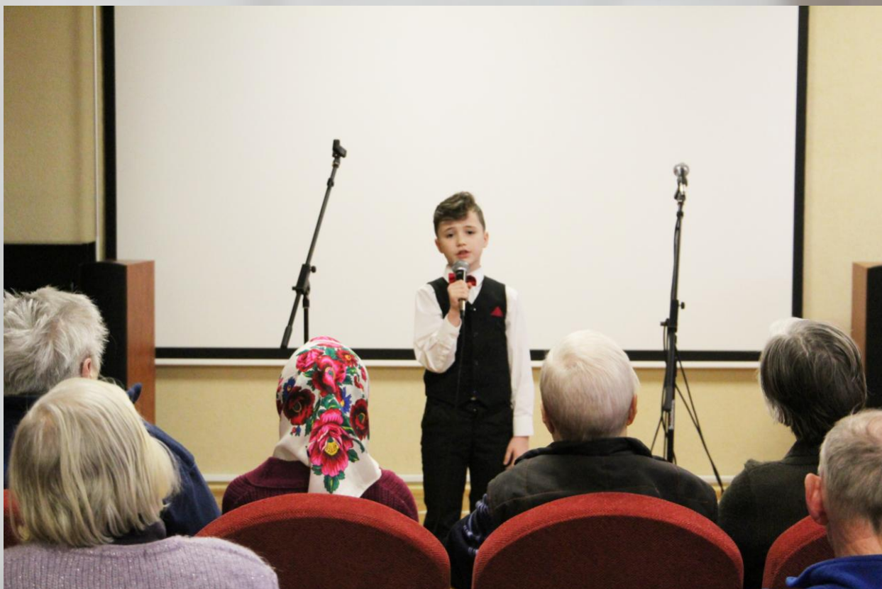
Концерт, приуроченный ко Дню пожилого человека в Доме ветеранов войны и труда

2. Проведение праздничных концертов для ветеранов войны и труда с приобщением воспитанников учреждений дошкольного образования и учащихся средних школ.