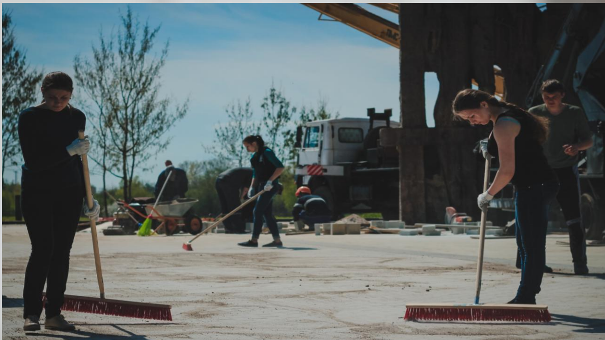
Благоустройство мемориального комплекса М.Тростенец с участием студентов факультета дошкольного образования

Цель проекта: содействовать формированию у детей и молодежи ценностного отношения к миру, уважительного, заботливого отношения к старшему поколению; приобщать студентов к деятельности по увековечиванию памяти героев и жертв Великой Отечественной войны.