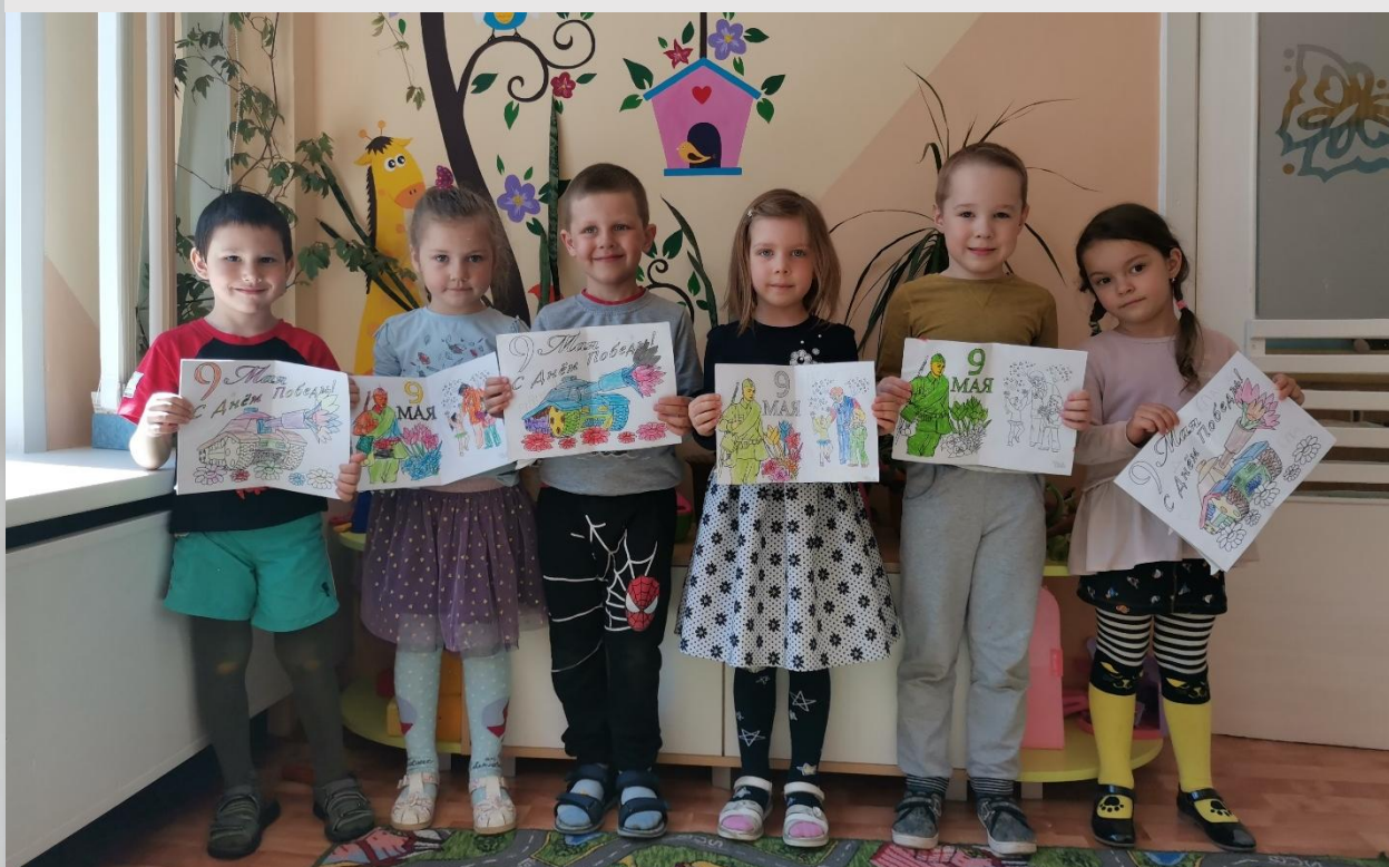
Воспитанники учреждения дошкольного образования с творческими работами на тему победы белорусского народа в Великой Отечественной войне