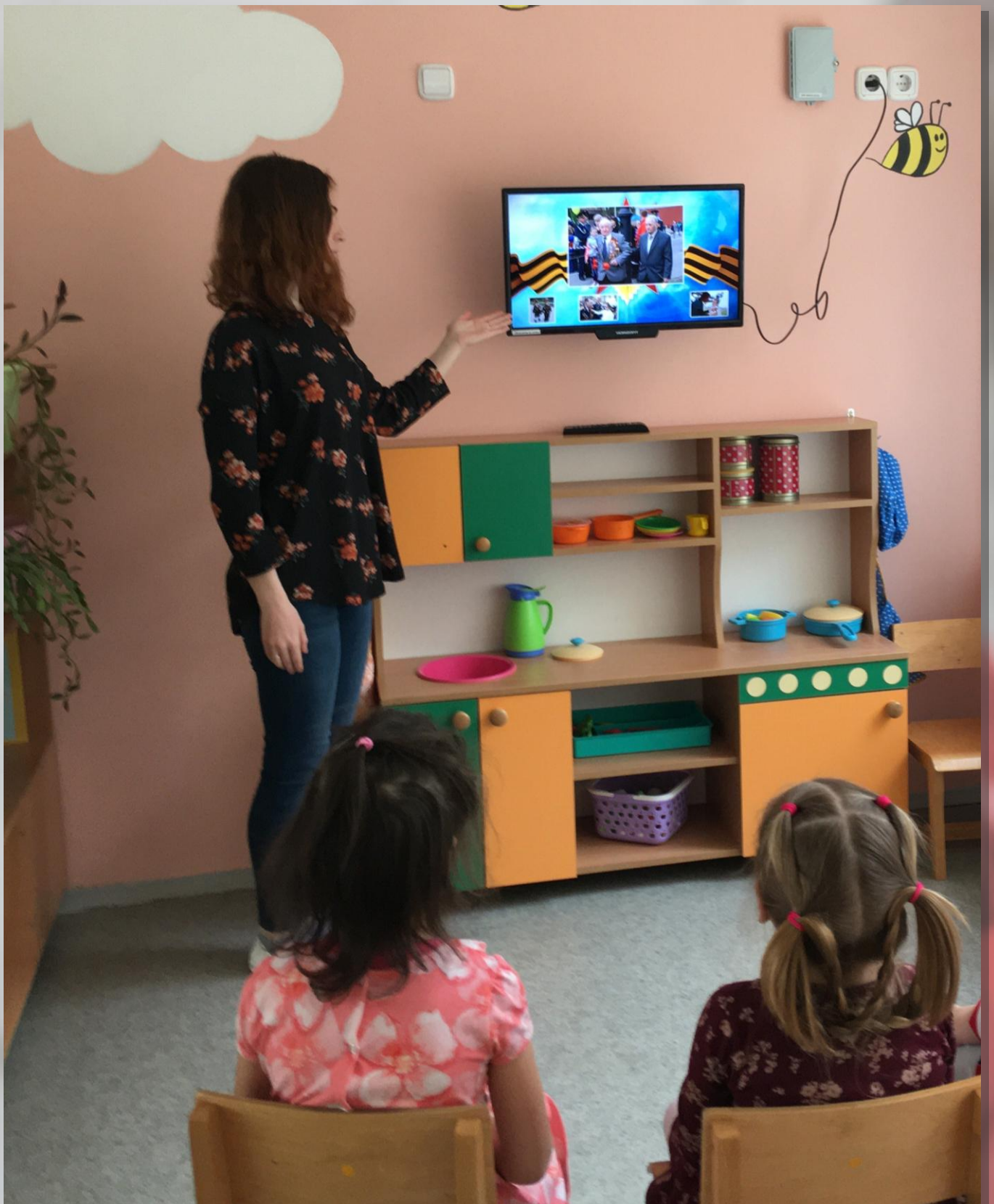
Студентка факультета дошкольного образования БГПУ проводит занятие о Великой Отечественной войне