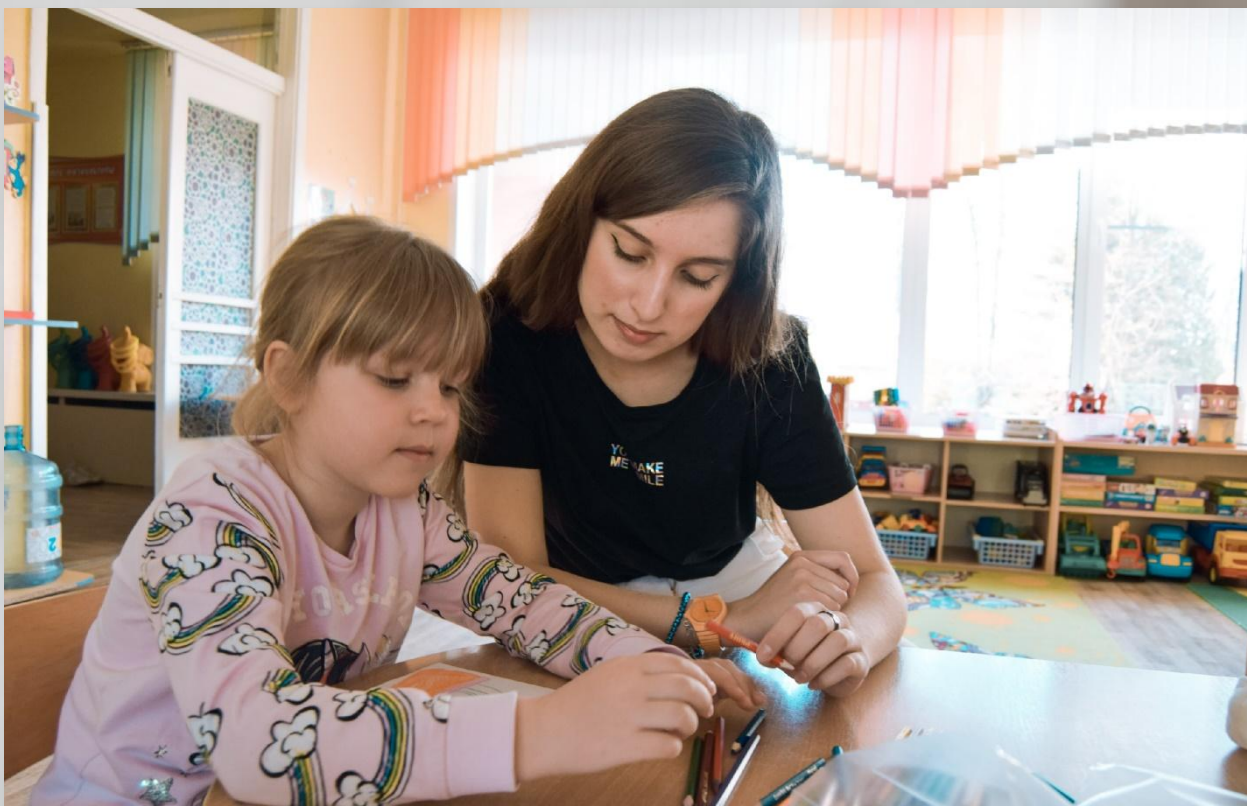
Совместное изготовление творческих подарков ветеранам Великой Отечественной войны

3. Изготовление детьми под руководством волонтеров творческих подарков для ветеранов Великой Отечественной войны и труда.