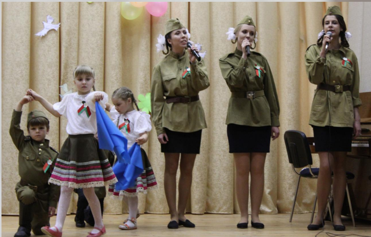
Совместный концерт студентов факультета дошкольного образования БГПУ и воспитанников учреждения дошкольного образования