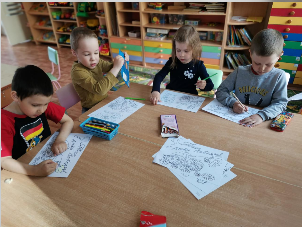
Воспитанники учреждения дошкольного образования рисуют «войну и мир»

4. Создание детьми коллективных художественных работ, посвященных подвигу белорусского народа в Великой Отечественной войне (в том числе в сотрудничестве с семьями воспитанников учреждений дошкольного образования).