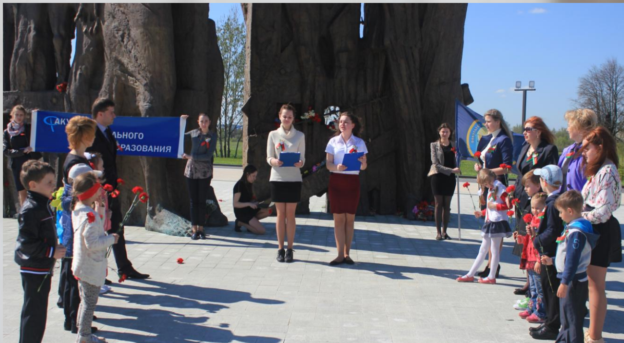
Мемориальный митинг у памятника «Врата памяти» на месте концентрационного лагеря М.Тростенец

5. Организация экскурсий для детей дошкольного возраста к памятникам героев и жертв Великой Отечественной войны.