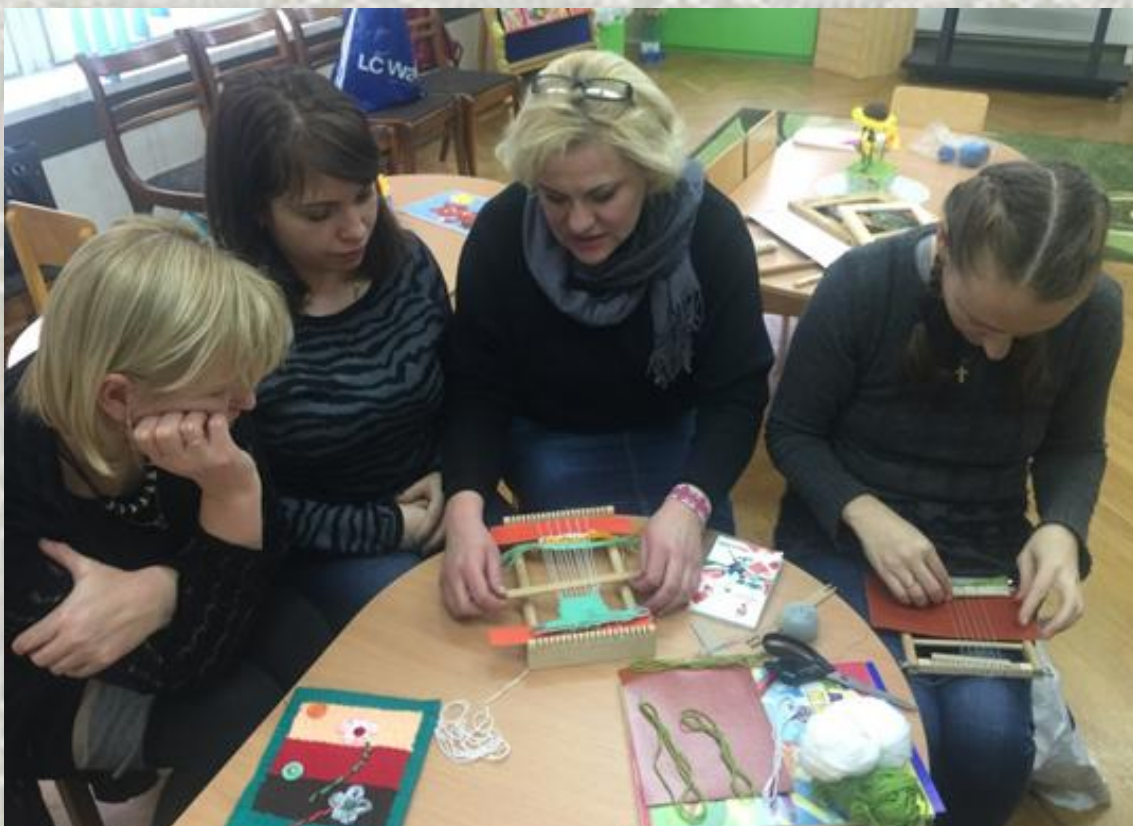
Майстар-клас ва ўстанове дашкольнай адукацыі па ткацтву