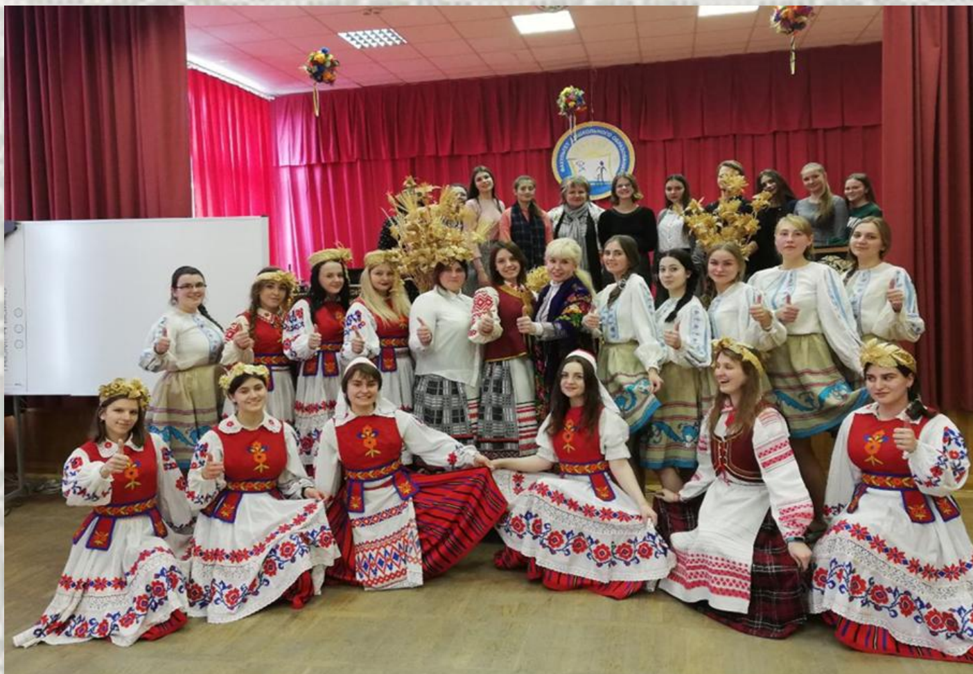
Дзень беларускай мовы на факультэце дашкольнай адукацыі БДПУ