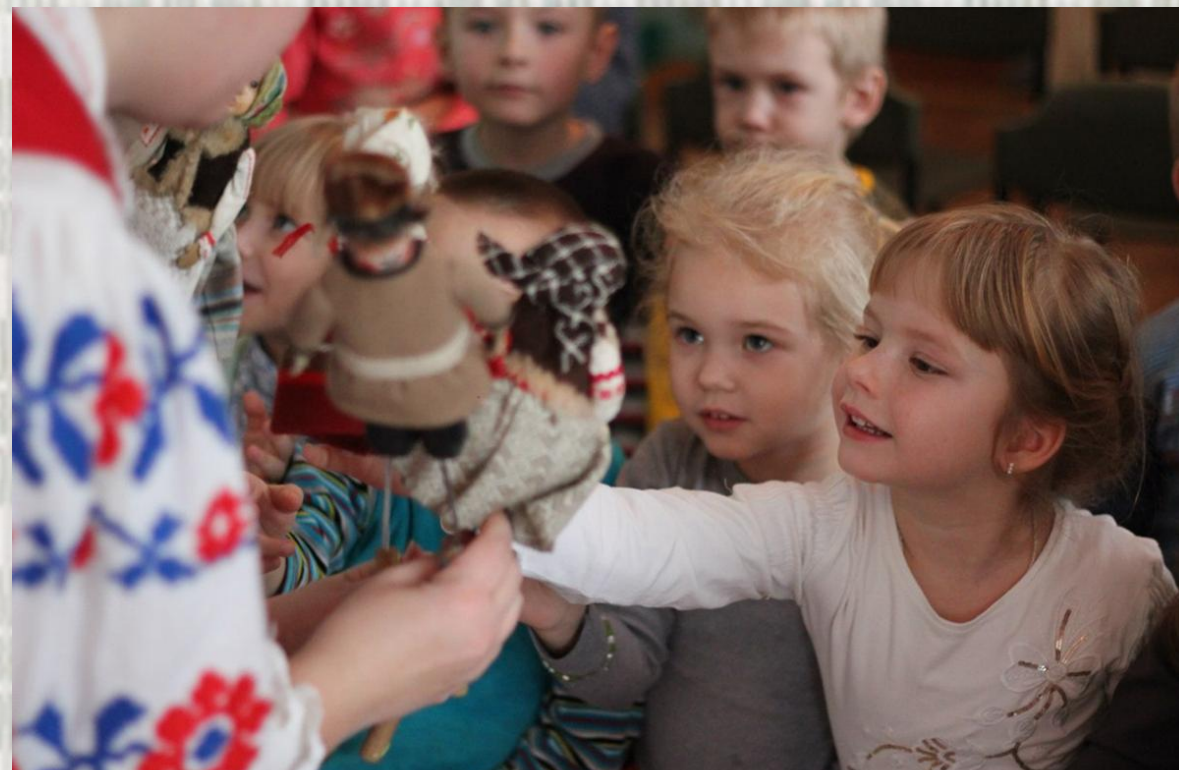
Майстар-клас па традыцыйнай батлейцы «Лялечная казка»

Для мяшчан хаджэнне з батлейкай было аматарскім заняткам, сродкам дадатковага заробку.