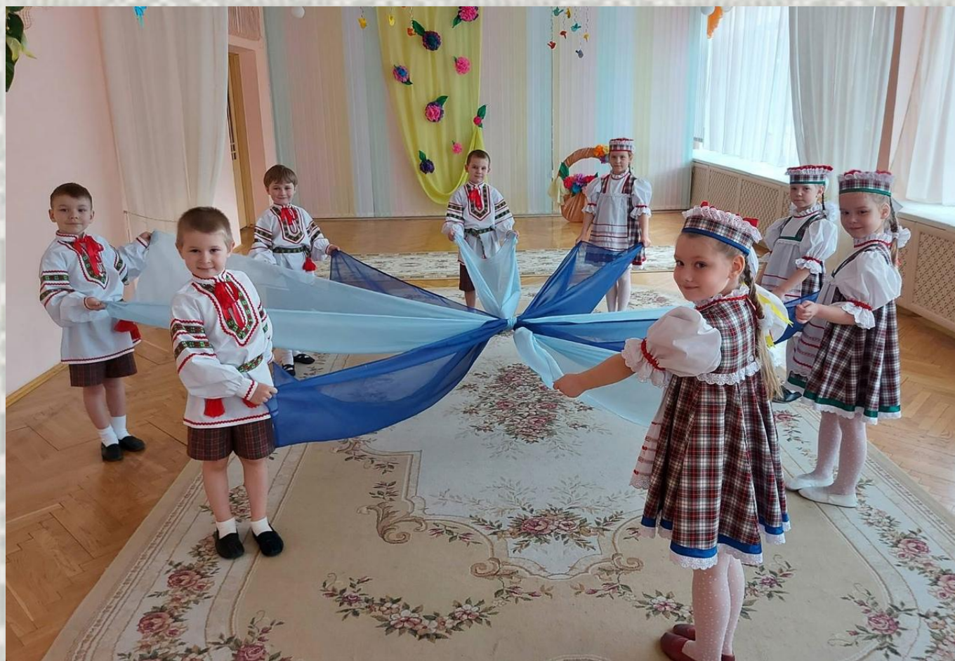
Беларускае свята ва ўстанове дашкольнай адукацыі