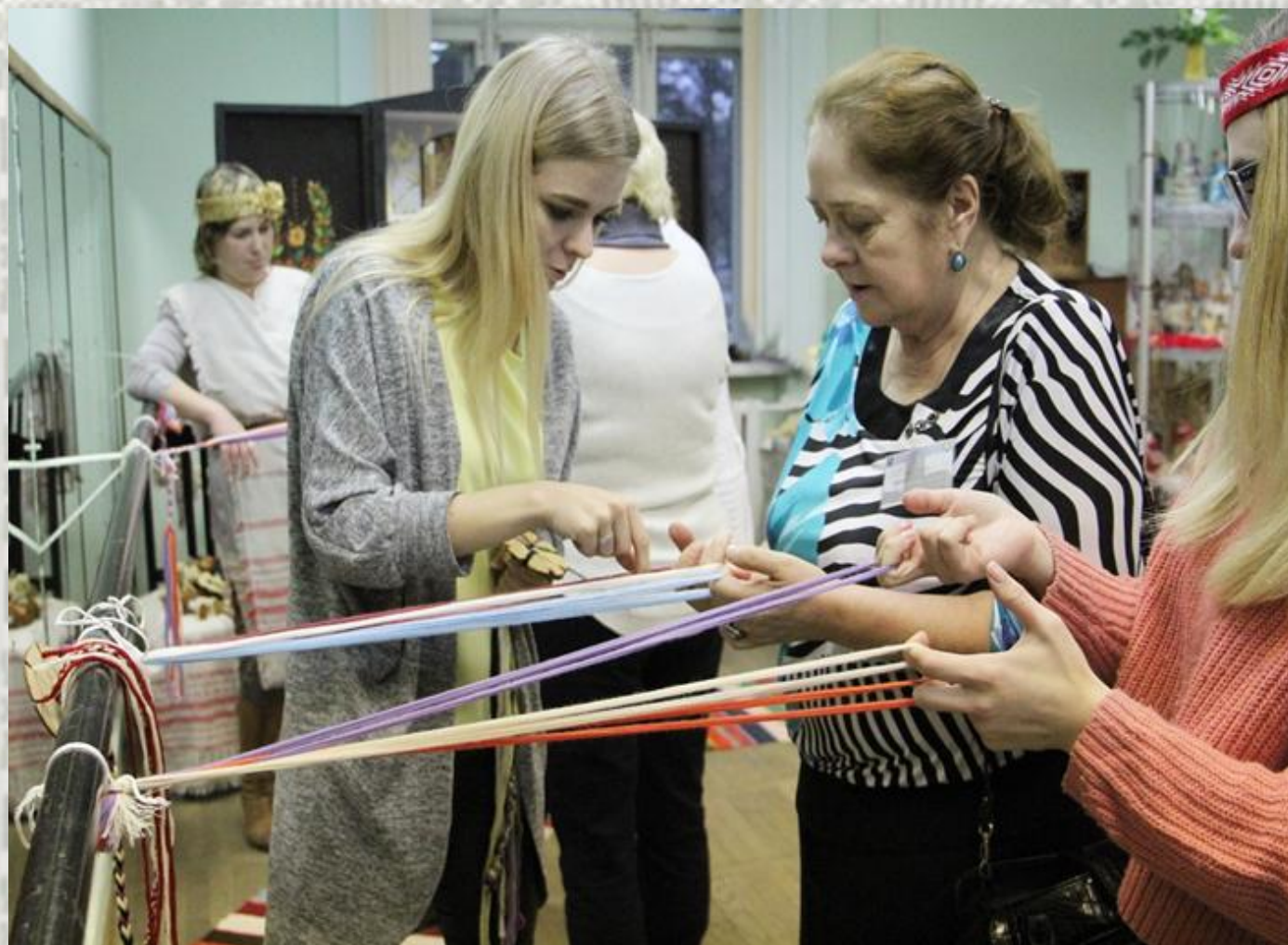
Майстар-клас па ткацтву з прадстаўнікамі дэлегацыі Маскоўскага абласнога педагагічнага ўніверсітэта (Расія)