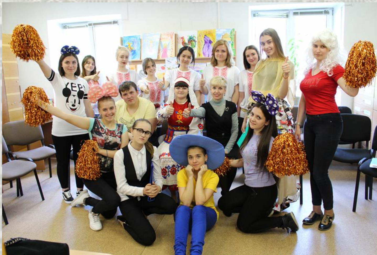
Свята «Старонка беларускай кнігі»