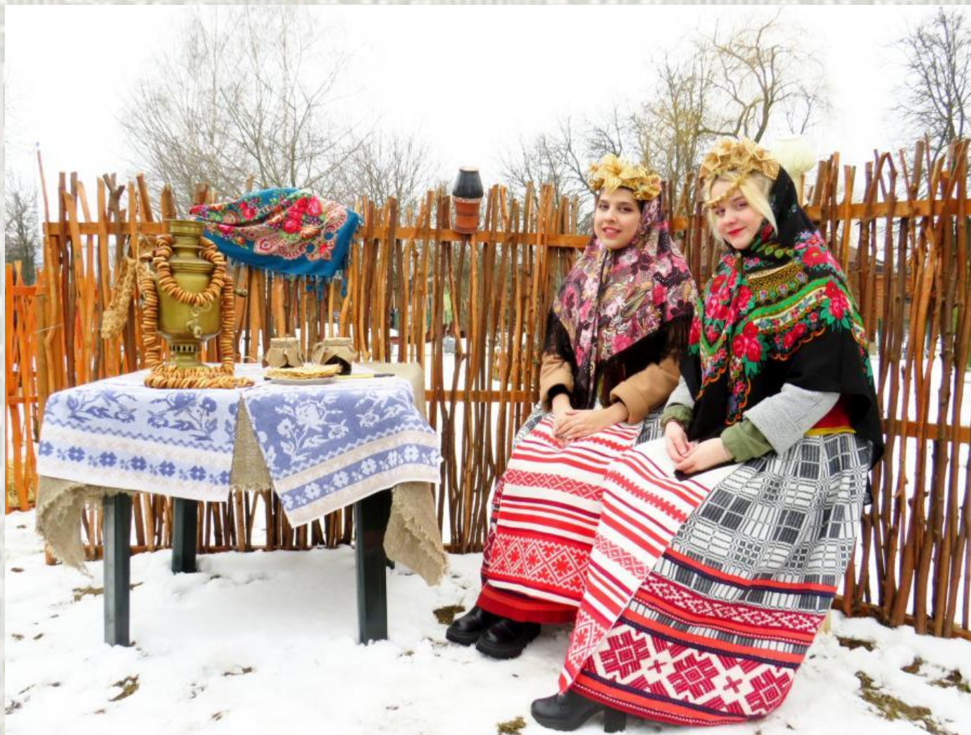
Свята «Масленіца» (мінські запарк)