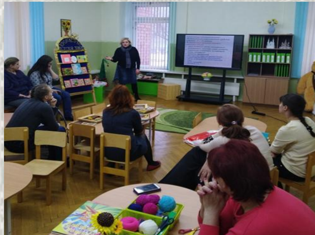
Семінар-практыкум ва ўстанове дашкольнай адукацыі па ткацтву