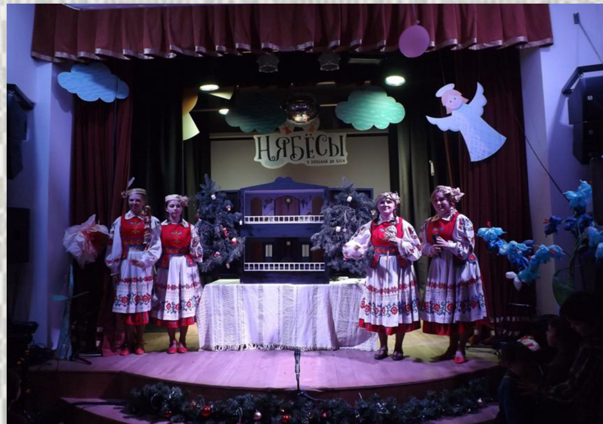
Студэнцкі лялечны тэатр «Адраджэнне Батлейкі»