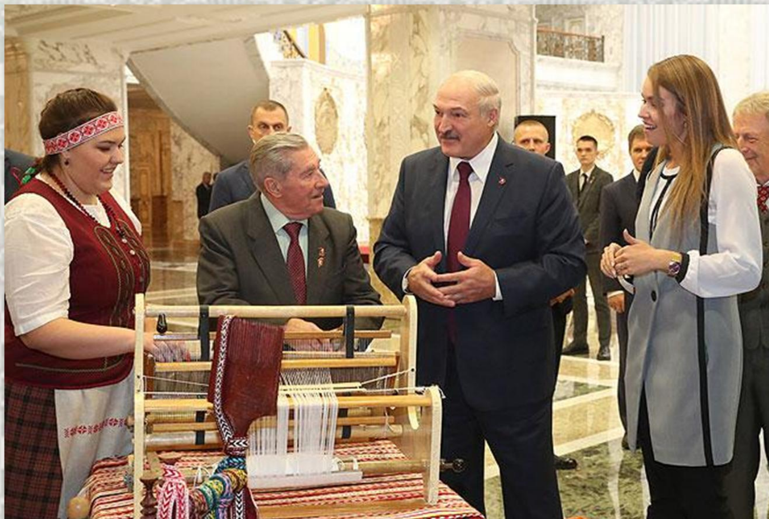
Майстар-клас па ткацтву падчас сустрэчы Прэзідэнта Рэспублікі Беларусь з моладдзю