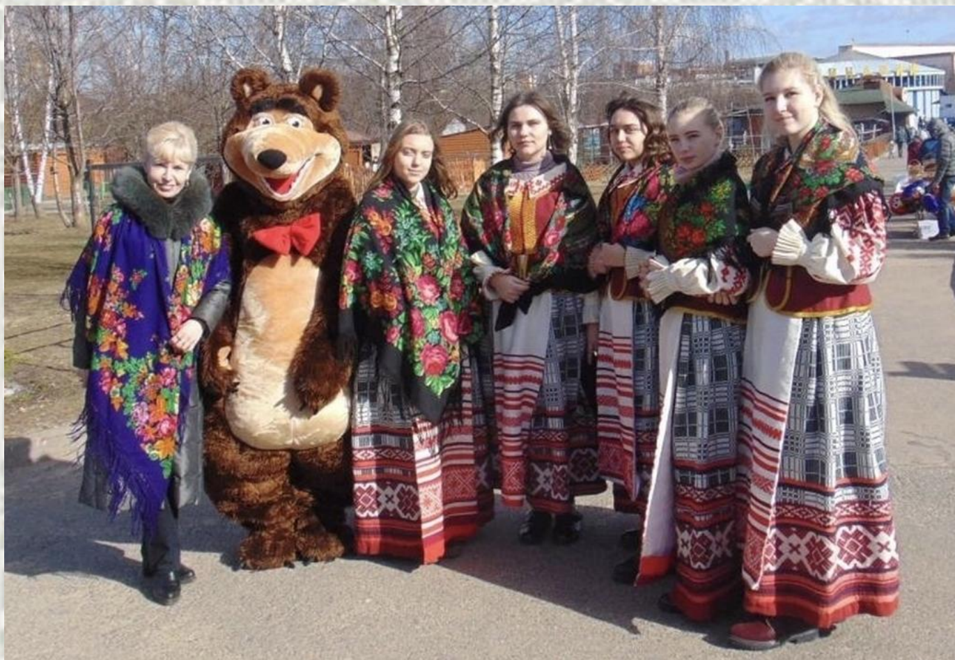
Свята «Гуканне вясны» (мінскі запарк)