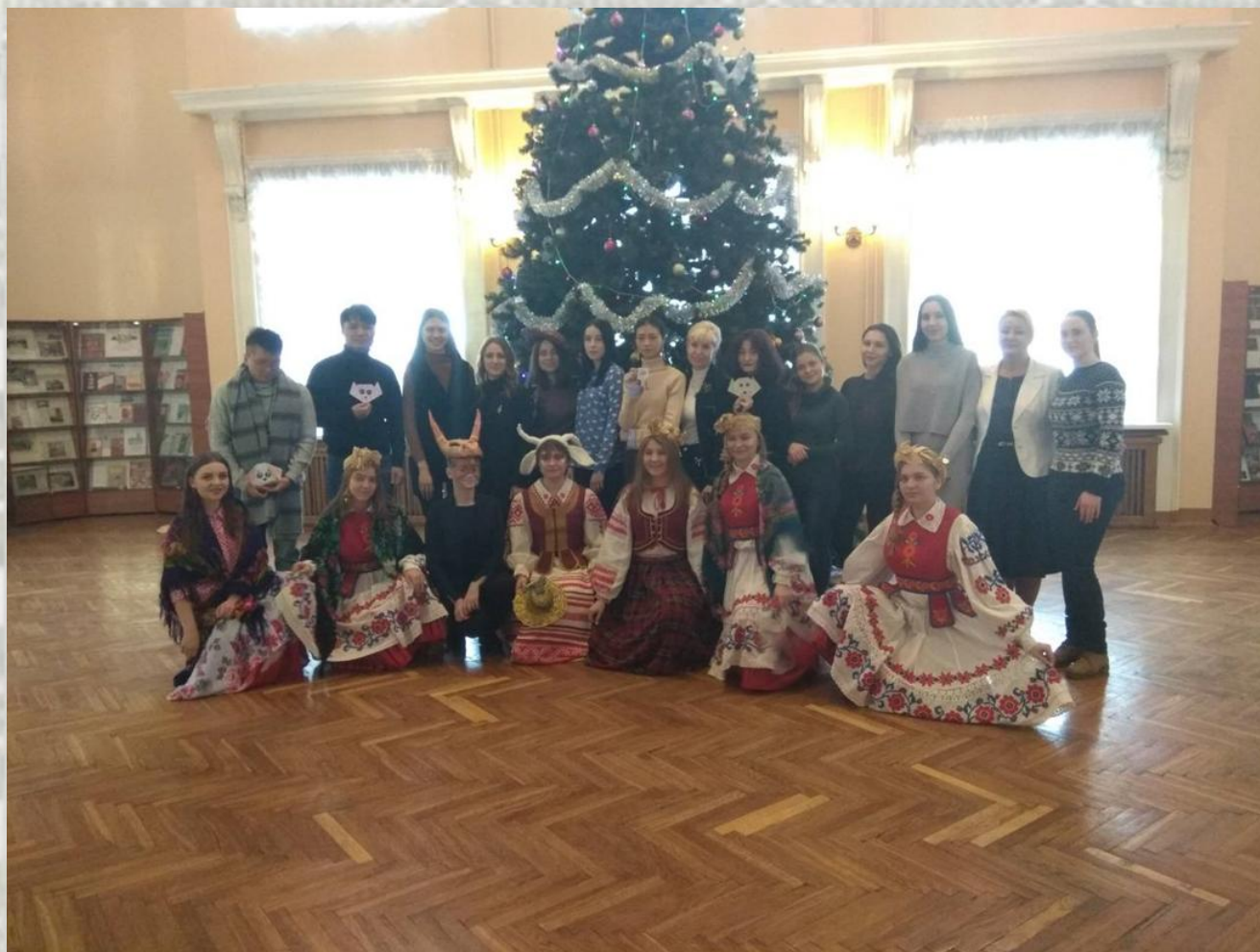
Свята «Ідуць Калядкі»