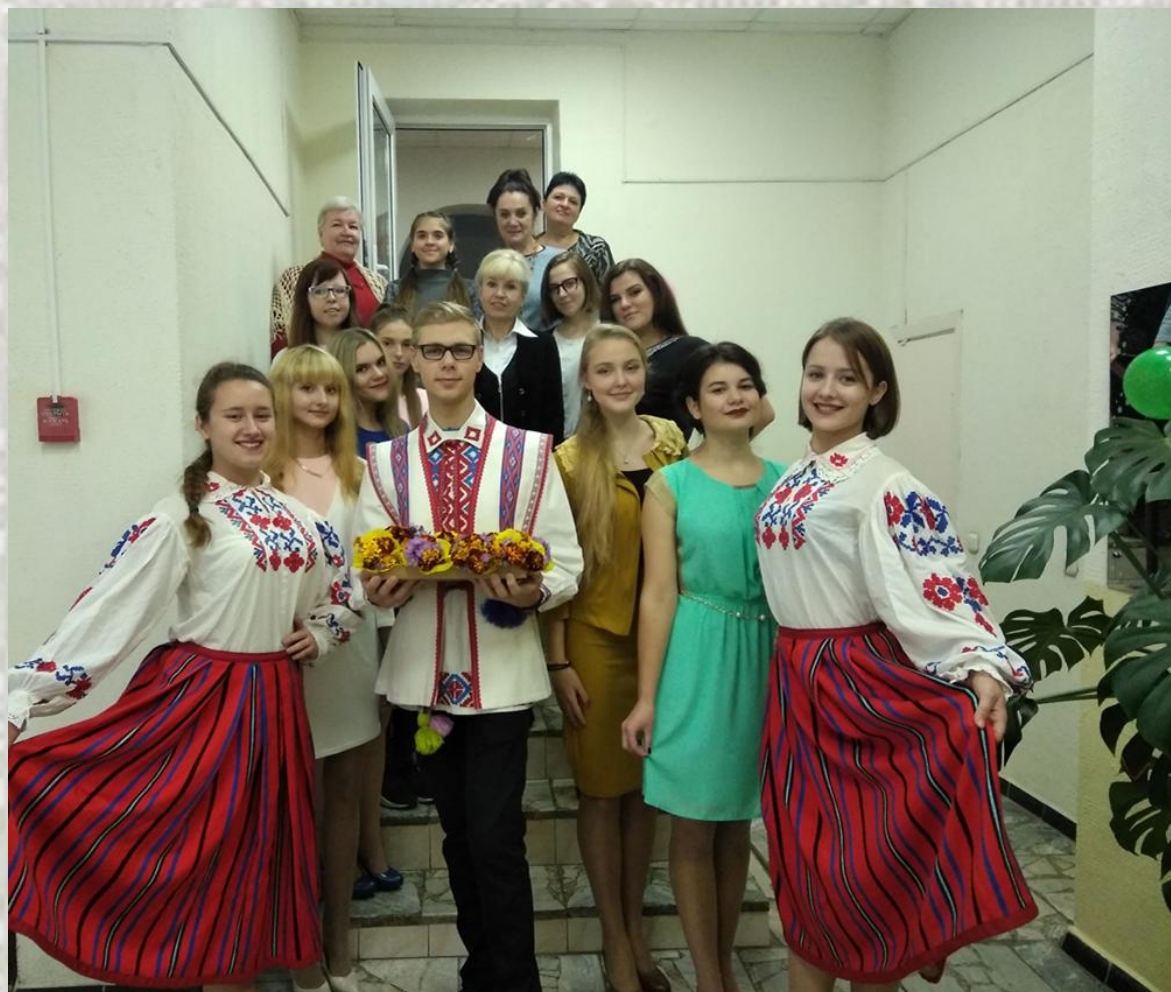
Свята «Дзень маці» ў бібліятэцы