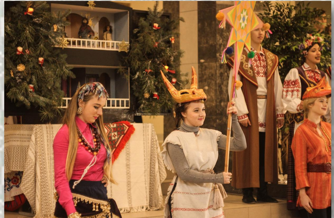
Калядныя інсцэніроўкі ў БДПУ

На тэрыторыі Беларусі найбольшае распаўсюджванне атрымалі лялькі на цвёрдым стрыжні. Стрыжань і цела лялькі звычайна вырабляліся з мяккіх парод дрэва, набіваліся ватай, рыззём, паперай. Памеры лялек звычайна былі ў сярэднім 23-27см. Але сустракаліся памеры і да 35 см (звычайна такімі рабіліся адмоўныя персанажы).