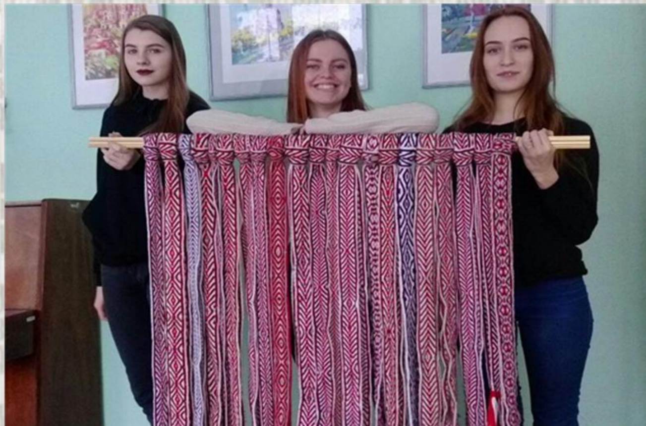
Студэнты БДПУ – навучэнцы адукацыйных курсаў па ткацтву