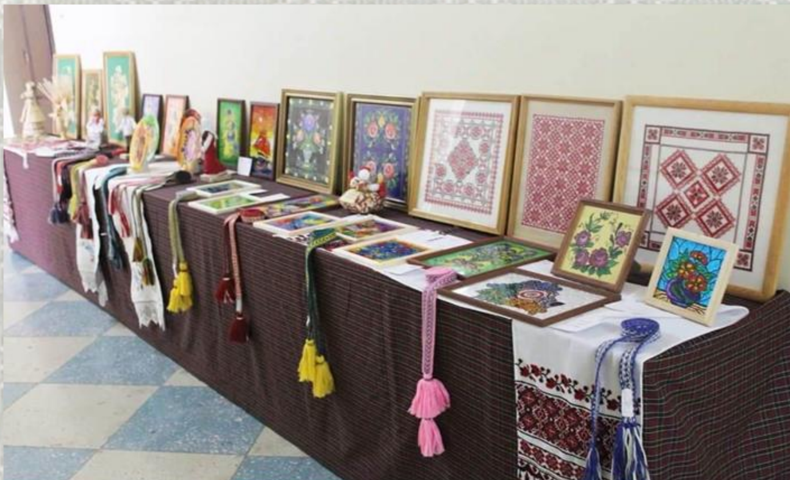
Выстава творчых работ студэнтаў факультэта дашкольнай адукацыі БДПУ «Родныя ўзоры»