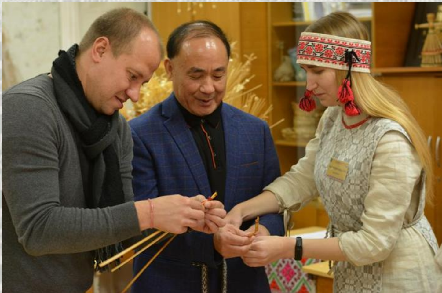
Майстар-клас па саломапляценню з прадстаўнікамі дэлегацыі Хэнаньскага ўніверсітэта і школы Ліньюг Лінчжоў (Кітай)