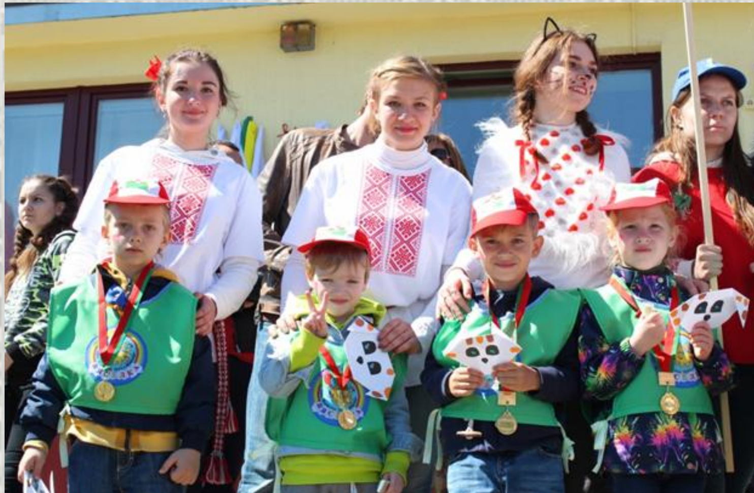
Тэматычная пляцоўка «Беларусі-Я-дачка» (беларускія народныя гульні для дзяцей дашкольнага ўзросту)