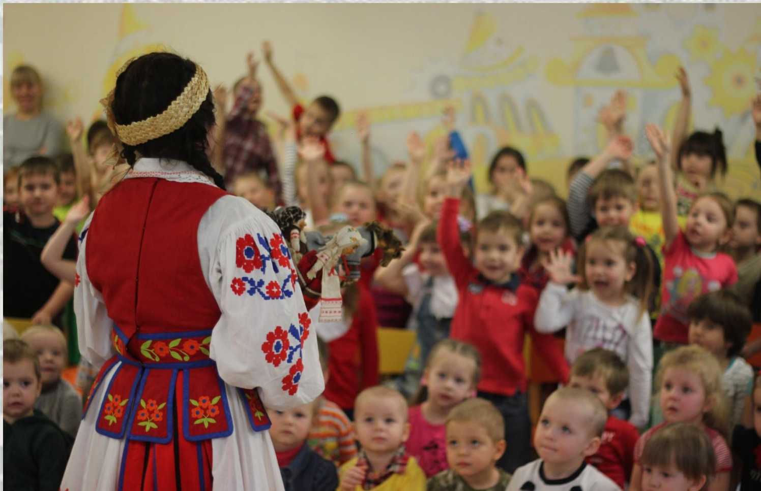
Майстар-клас па традыцыйнай батлейцы для выхаванцаў установы дашкольнай адукацыі