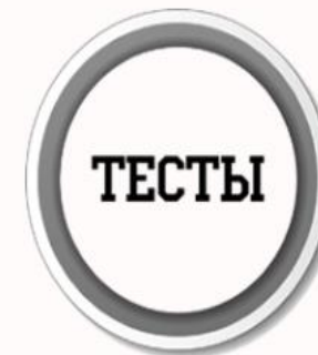
Раздел контроля знаний

Материалы для семинарских занятий по дисциплине