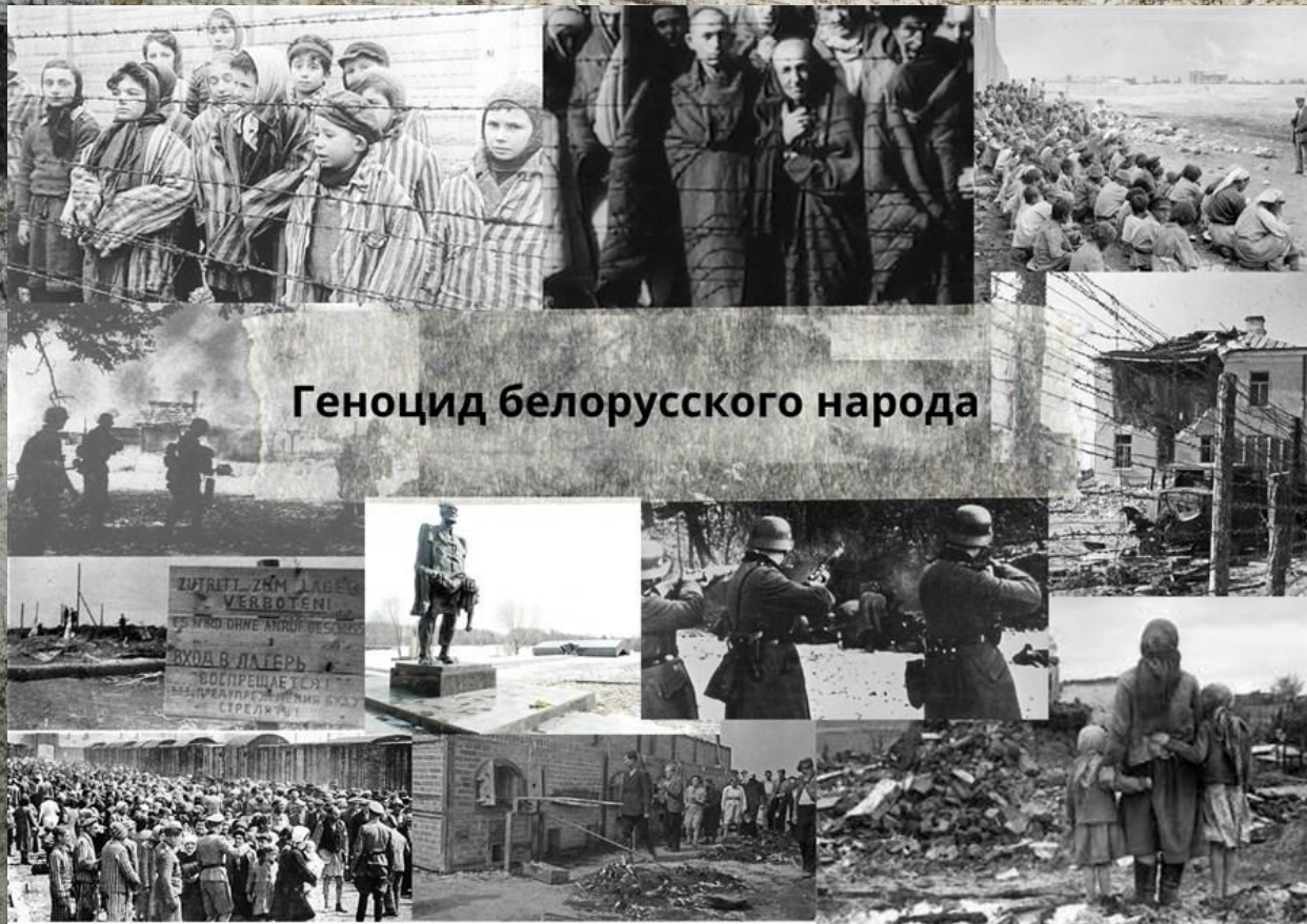
Геноцид белорусского народа

Геноцид белорусского народа: деятельност ные формы работы с молодежью по изучению проблемати ки