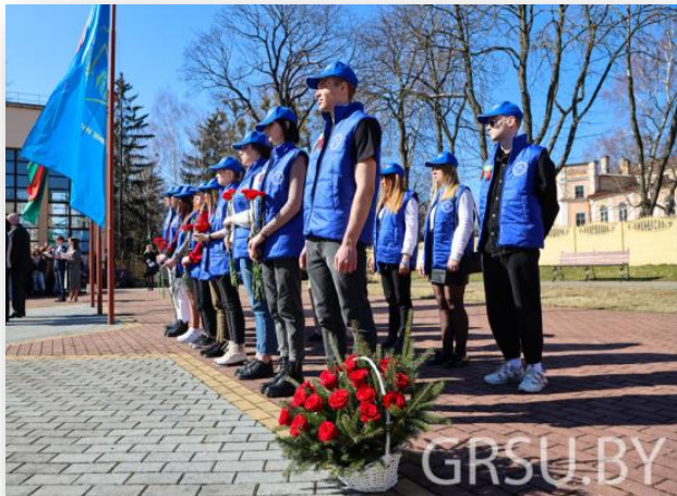
Митинг-реквием «Купаловцы помнят» на Площади университетского флага в День памяти жертв Хатынской трагедии (22.03.2022)

В рамках акции «Купаловцы помнят» проходят митинги-реквиемы, возложения цветов к могилам солдат, погибших во время Великой Отечественной войны, автопробеги и другие мероприятия, приуроченные памятным датам Великой Отечественной войны