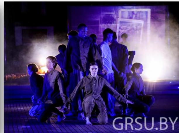
Военно-патриотическая акция «Память», приуроченная Дню всенародной памяти жертв Великой Отечественной войны и геноцида белорусского народа