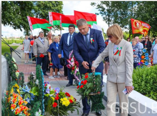
Патриотический автопробег в рамках акции «Купаловцы помнят» (22.06.2022)