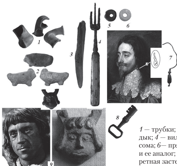
1 — трубки; 2 — окарина; 3 — кочедык; 4 — вилка; 5 — позвонок сома; 6 — пряслице; 7 — серьга и ее аналог; 8 — ключ; 9 — портретная застежка и ее аналог