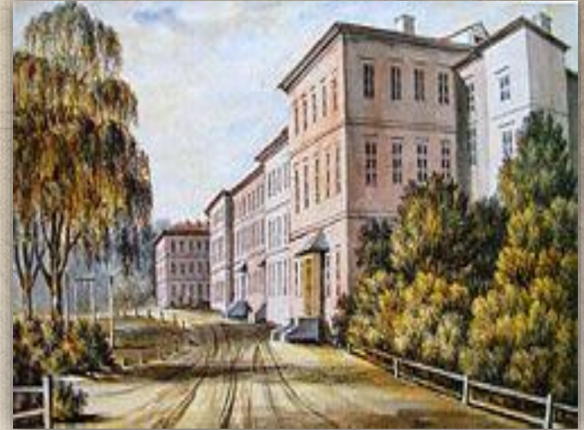
Рисунок здания института Наполеон Орда, XIX век