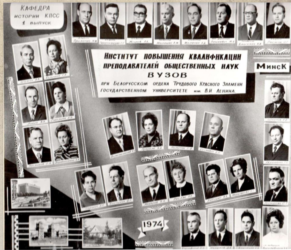
Первый выпуск в Институте повышения квалификации преподавателей общественных наук 1974 год

50 лет назад в Минске приказом Министра высшего и среднего специального образования СССР № 72 от 20.02.1973 г. открыт Институт повышения квалификации преподавателей общественных наук при Белорусском государственном университете имени В.И. Ленина, с 1994 г. – Республиканский институт высшей школы.