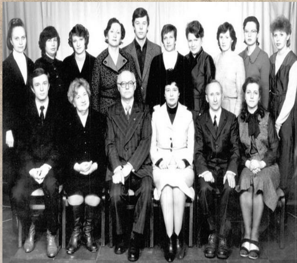
Коллектив кафедры педиатрии лечебного факультета, Гродненского государственного медицинского института 1982 г.