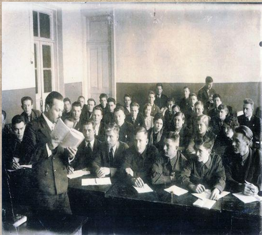
Студенты исторического факультета, 1930 -е годы